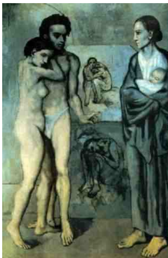
Figura 1: obra A Vida - Pablo Picasso – (196,5 x 129,2 cm, 1903) Museu de Arte Cleveland, Estados Unidos ( apud GÊNIOS..., 1969).

Uma das imagens oferecidas a eles para leitura foi A Vida de Pablo Picasso, o menino que aprendeu a ler por meio de desenhos. Trata-se de uma das obras criadas por ele em sua “fase azul”, na qual ele representa sua vida de forma melancólica, convergindo nela o amor, a maternidade, o desamparo.